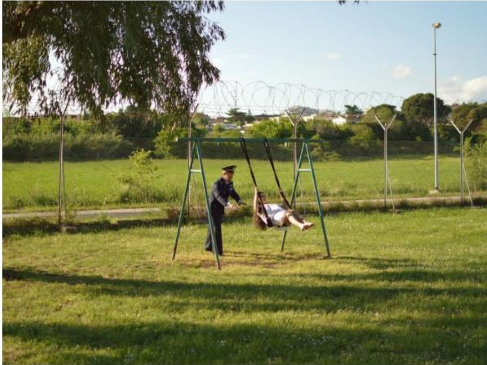
FASE REM 5, Vidéo HD full 1920X1080, couleur, durée 04:57, dimensions variables © Romina De Novellis /Maldonaldo; © De Novellis/Bordin, Courtesy Galerie Laure Roynette

16 oct. — 29 nov. 2015 à la Galerie Laure Roynette à Paris, France