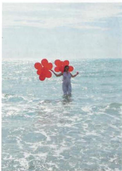
Romina De Novellis, FASE REM 9, 2014, vidéo couleur.

• «60 ans de mouvement, premières générations», Galerie Denise René, Espace Marais, 22, rue Charlot, Paris-3 e ; et «Pe Lang, une nouvelle voie», Galerie Denise René, rive gauche, 196, boulevard Saint-Germain, Paris-7 e , www.deniserene.com